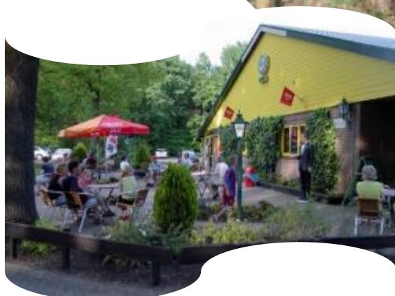
Terras bij restaurant